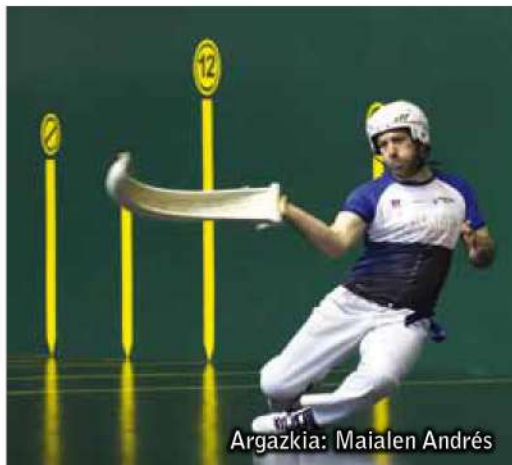
Argazkia: Maiaalen Andrés

Amaitu berri da GRABNI Txapelketa, bertan aritzen dira dauden jokamolderik gehienetan Gipuzkoa, Bizkaia, Araba, Nafarroa, Errioxa eta Iparralde. Dudarik gabe garrantzitsua da lehiaketa hau, federazioen artekoa baita, eta gainera jokamolde batzuei denboraldia luzatzeko, eta partida gehiago jokatzeko ere balio die.